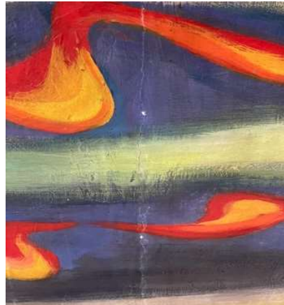
『明日の神話』の傷み_2