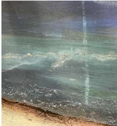
『明日の神話』の傷み_1